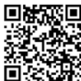
電子図書館 QRコード

インターネット上の図書館、電子図書館サービスが始まっています。音声読み上げ機能や文字拡大機能、図書館まで遠い、行く時間がない方も気軽に本を読んで頂けます。